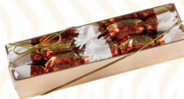
Szamos töltött marcipán szaloncukor meggyes