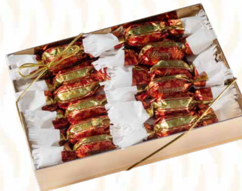
Szamos töltött marcipán szaloncukor meggyes