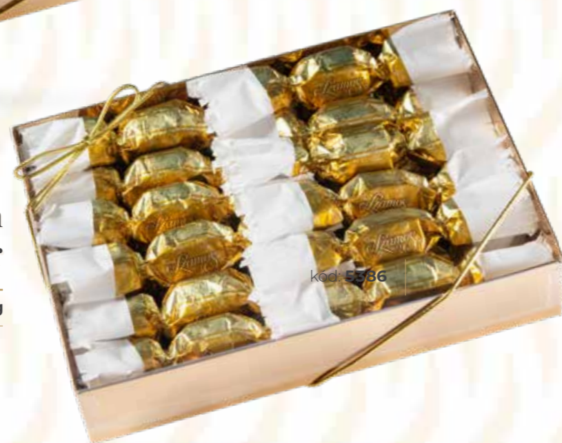
Szamos marcipán szaloncukor