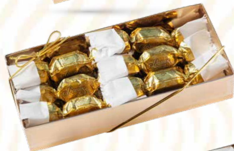
Szamos marcipán szaloncukor