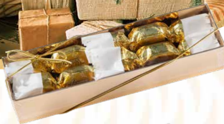
Szamos marcipán szaloncukor