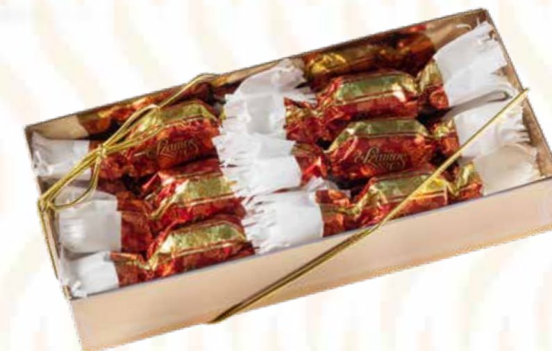
Szamos töltött marcipán szaloncukor meggyes