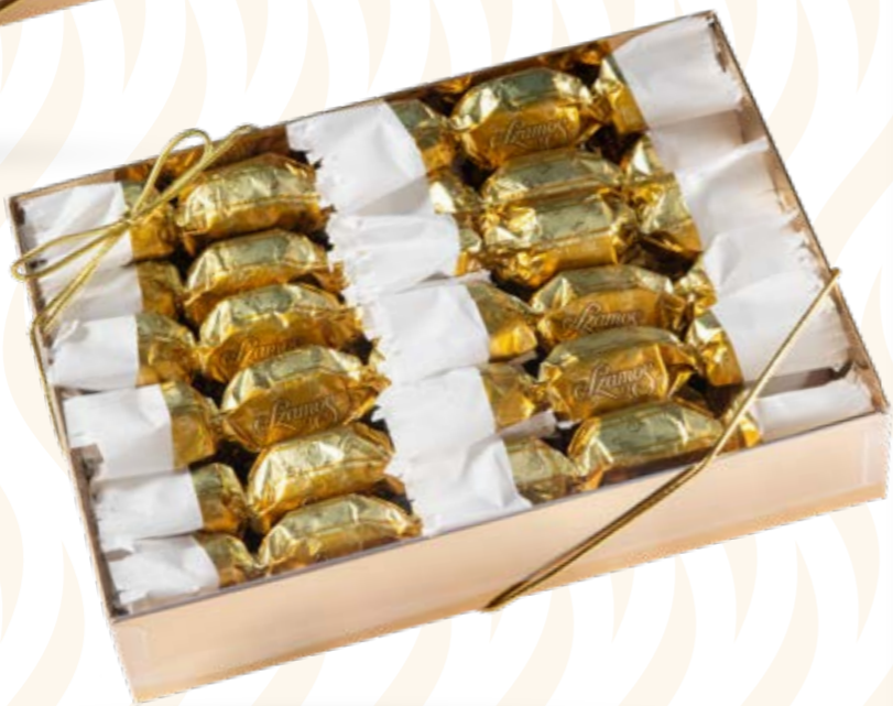
Szamos marcipán szaloncukor