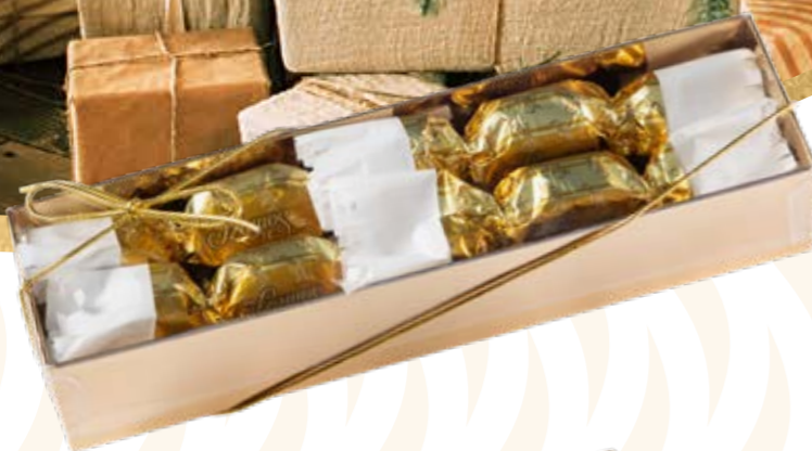
Szamos marcipán szaloncukor