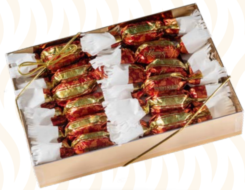
Szamos töltött marcipán szaloncukor meggyes