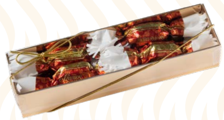
Szamos töltött marcipán szaloncukor meggyes