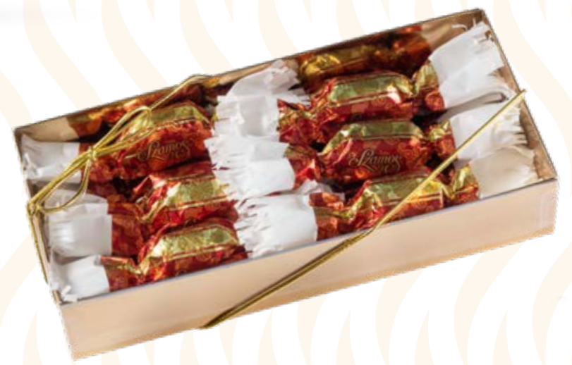
Szamos töltött marcipán szaloncukor meggyes