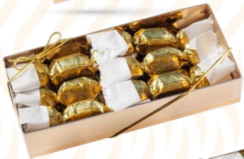
Szamos marcipán szaloncukor